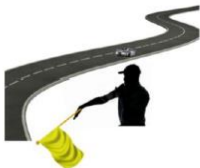
INMOVILIZADO A LA DERECHA