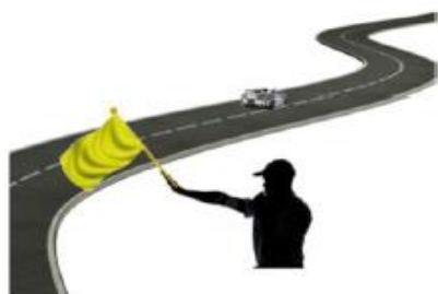
INMOVILIZADO A LA IZQUERDA