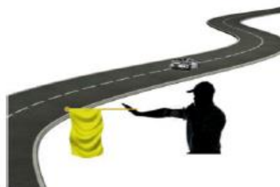
INMOVILIZADO EN EL CENTRO